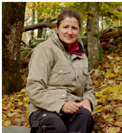
En gammal gran har till synes hel meningslöst fällts vid Svinalejet. Till höger njuter gruppens enda kvinnliga deltagare av höstens sista vackra färger. Efter vår tur kom frosten och löven föll.