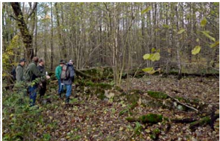
Till vänster syns en riktig prima jordkällare och till höger en del av resterna av byggnaderna.