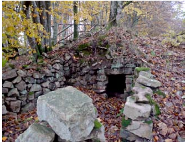
Rester av Kvärkaskogen 1 inspekteras av Kulturföreningen. Till höger syns en primitiv jordkällare.

huset och en jordkällare finns kvar. Ägare av jorden sedan 1930-talet Gustavsborgs säteri eller medlemmar av fam Wendt.