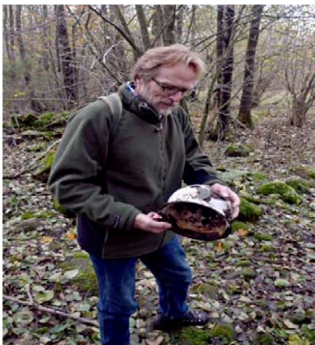
Gruppens egen "arkeolog" har gjort ett sensationellt fynd.