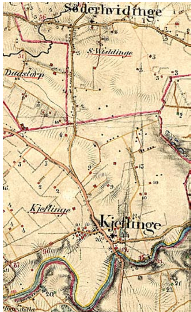
Utsnitt ur generalstabskartan ca 1860.

mer ut mot Södergatan ser vi framför oss ett stort Y-torg. Det enorma huset i rött tegel rakt fram ligger i dag där till höger Gethingevägen och till vänster Kävlingevägen började under Lunds första tid för 1000 år sedan. Gatudragningarna innebar att Lund hade 5 stadsportar. Detta var naturligtvis ekonomiskt och porten med sin tull drogs in under tidig medeltid. Fortsätter vi Kyrkoga-