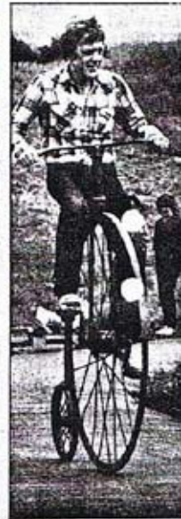
Cykling i all åra men cykling på en sådan här auk kräver lite träning och utställighet. Men på Röstängs sommarland har du chansen att göra det.