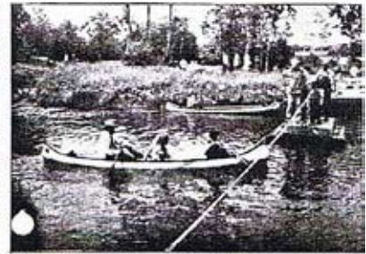
Kanotpaddling är ett inbete för besökaren på Röstängs sommarland. Här har du chansen att prova hur det är i en tryggare, tre krävande miljö.