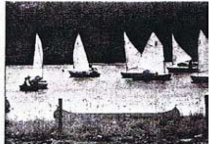
Det nya för året i Röstängs sommarland är möjligheter att segla jolle. Man har grävt ut en speciell damm.