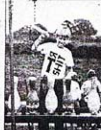
Lekar inte något annat just för tillfället kanake ett kagelspel kan vara något.