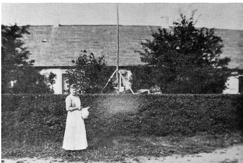
Boningslängan från gårdssidan, efter restaureringen på 1870-talet. Det är inte en flaggstång utan en äskledare av trä som syns på bilden.