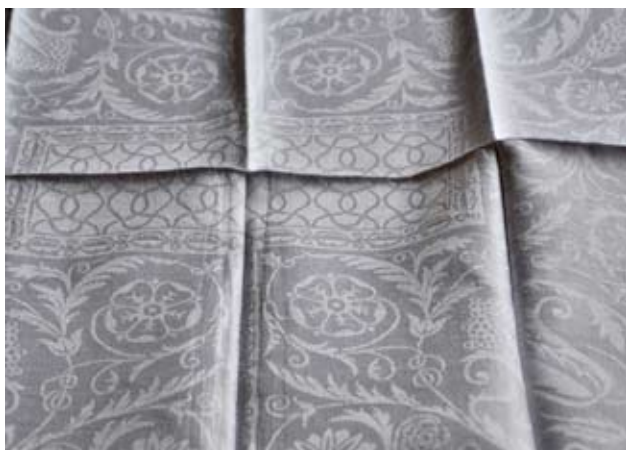
Linnedamast från Almedahls med mönstret Läckö, som var en storsäljare. Bilden är tagen i "släpljus" av Stig Pettersson.

gått till återvinning? Jag kan inte ens påminna mig ha sett hembygdsdräkter här. Däremot känner jag folk, som är så skickliga skraddare att deras plagg gott kan kallas haut couture.