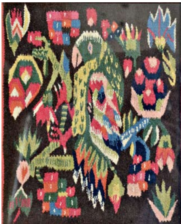
Mönstret till denna flamskväv är hämtat från en av de Agedynor som är klassiska vävnader från Everlöf.