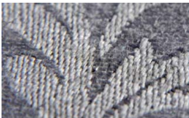
Bild av samma i duktigt kraftig förstoring gör att man ser var den ljusa respektive mörka effekten kommer från.