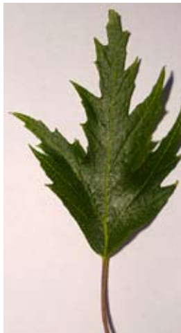
Foto på blad från björken i Röstånga.

Hade jag emellertid ställt frågan ovan lite anorlunda; t.ex. minns du något träd från din barndom som betytt något för dig är jag övertygad om att nästan alla kunnat berätta sin egen unika historia. Kanske om ett speciellt klätterträd eller ett körsbärsträd med särskilt goda bär eller kanske ett träd med alldeles speciella former. Barn och träd hör ihop på något märkligt sätt. Som de flesta vet finns det ju många trädupplevelser från barndomen beskrivna i litteraturen. Inte sällan skildras barnets vördnad för träden och som då får träden att framstå som trygga och kloka