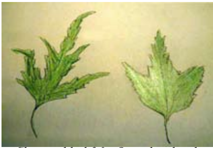
Skiss av blad från Ornärbjörk och fransbjörk.

ursprung och med det latinska namnet Betula pendula crispa .