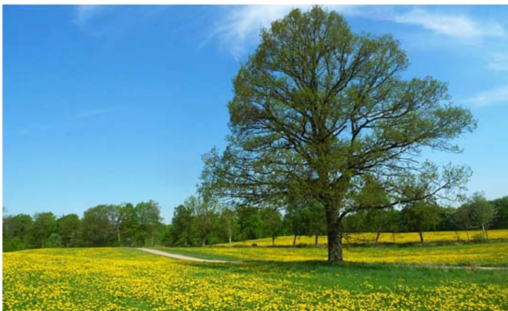
Eken mellan Röstånga och Odensjön. I bakgrunden syns den gamla fägatan.

ligt definition en gammelek) och av sambandet mellan omkretsar och årsringar från ett stort antal ekar bör åldern på vår ek kunna uppskattas till 200 år, men den kan vara betydligt äldre än så. Hon har alltså stått här vid en tid då det inte fanns några motorljud. Men kanske blickade hon västerut mot fägatan och hörde kornas råmande eller kanske nådde henne ljudet från en osmord vagnaxel på en oxdragen kärra eller från de malande kvarnstenarna långt borta vid Nedangården. Att eken här uppe på fältet fått en viss uppmärksamhet kan kanske bero på att den utgör någon form av årstidskalender för dem som promenerar förbi.