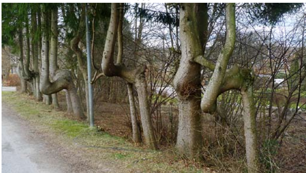
Längs Björkgatan växer dessa märkliga granar som får fantasin i rörelse.