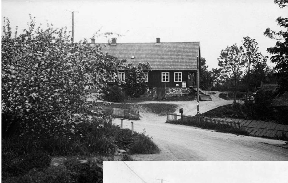
Nackarps gård, på gaveln syns ingången till Postlokalen som fanns här mellan 1914-1935. Lokalen var otidsenlig. Tillträdet måste ske via en hög och obekväm trappa, vilket vintertid hade vållat flera olyckstillbud. Den 1 februari 1935 flyttade Posten till Stationshuset.