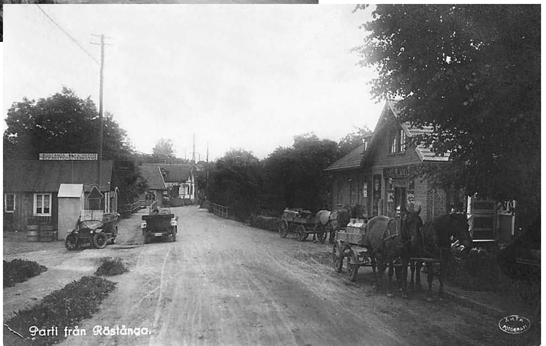
Parti från Röstånga.