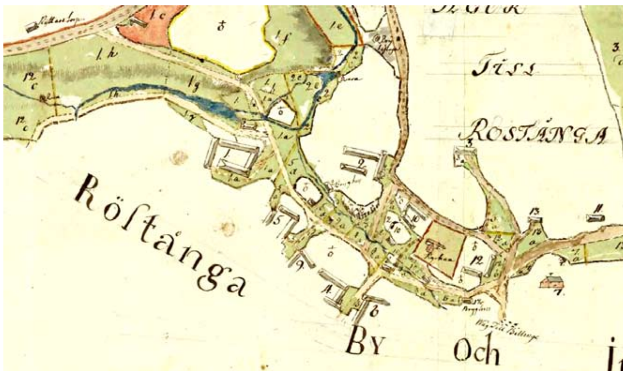
Utsnitt av karta från 1808.