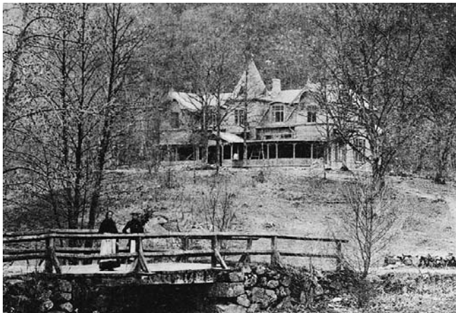
Turisthotellet i Skäralid, nybyggt.