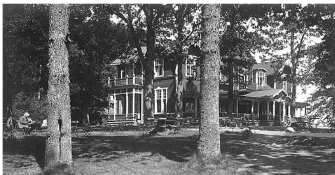
I Skäralid, tid för vila och rekreation.

I september samma år har man övertagit besittningsrätten för tomten i Skäralid. Man sparar inte på kostnaderna. En faktura från Mönlycke Manufaktur AB på 10.171 (572 000) skvallrar om att man valde bästa kvalitet till inredningen i Skäralid. År 1912 friköper man marken med tillhörande skog från Majors-