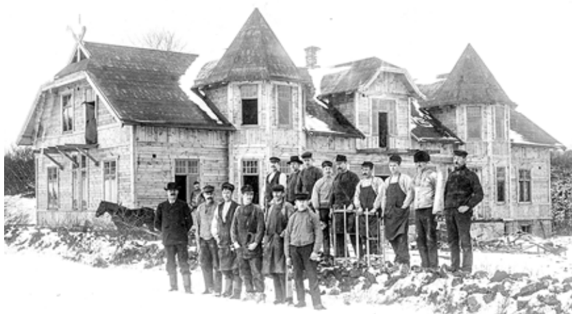
"Annexet" under uppbyggnad 1904. Känt senare som "Turisthotellet". I dag kallat "Villa Söderåsen".