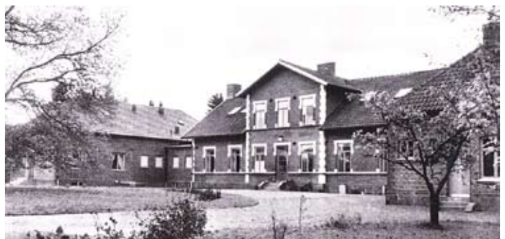
Allarps gård runt 1960.

Ordet landsbygdsutvecklare fanns knappast vid den här tiden, men nog var herrarna från Härsnäs och Röstånga Sparbank föregångare på detta område. Att det dessutom gav ett inte oväsentligt överskott att dela på borde väl inte göra historien sämre. Nu kunde man återgå till skötseln av sina övriga uppdrag och