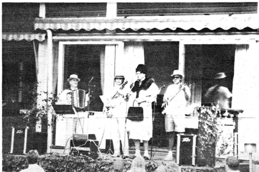
Den här "damen" var kvällens hemliga gäst under årets första onsdagskväll i Röstånga. Hon varnade sina medsyststrar för "pojkar över 65. . ."