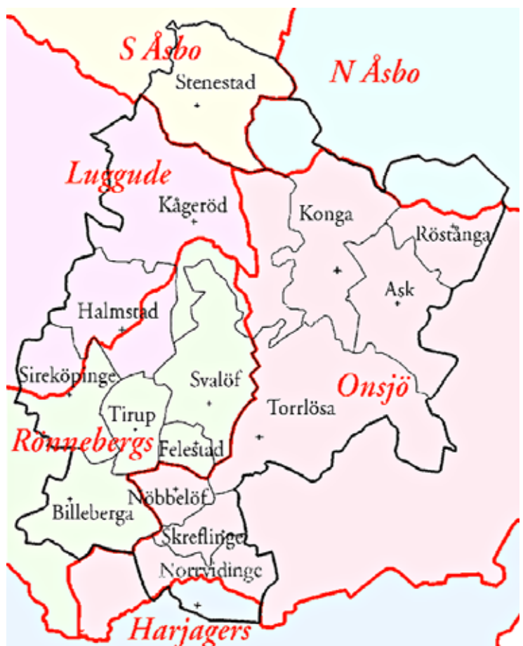
Häradernas uppdelning före 1887 i nuvarande Svalövs kommun.