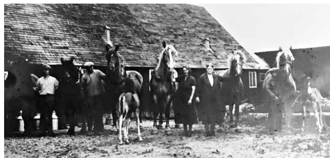
Syrehuset under Kongaö, senare kallat Granliden.

För mig representerade farmor och farfar höjden av trygghet. Det bästa jag visste, var