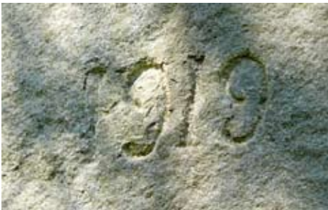
Bronfärdigställdes år 1919