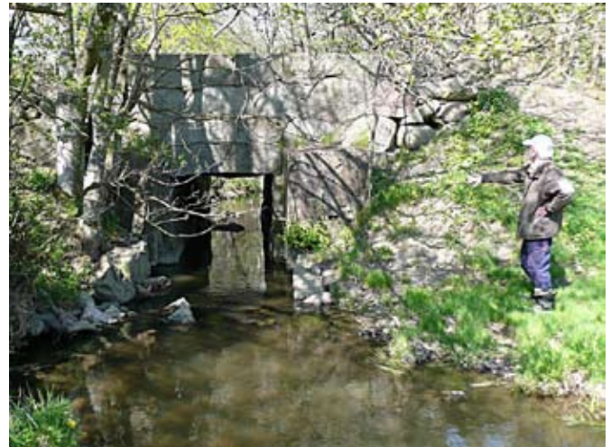
Upströms ifrån är bron mycket imponerande