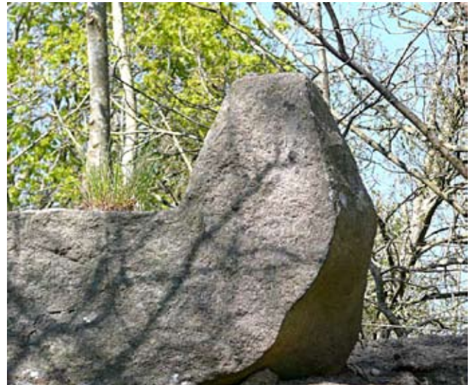
Avslutningen på brons sydöstra hörn är mycket vackert huggen