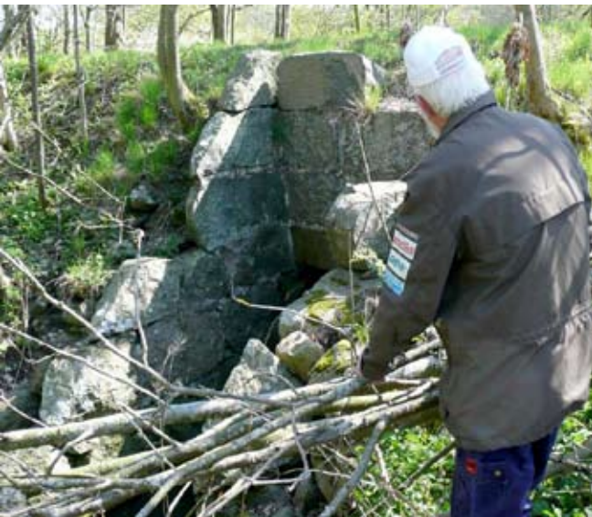
Broblockarna är imponerande 2 m gånger 40 cm