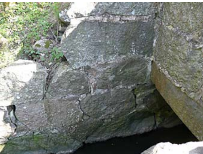
Huggen sten även i sidorna