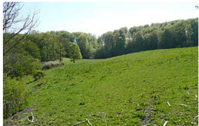
Vy över familjen Perssons kohage från det västra brofästet