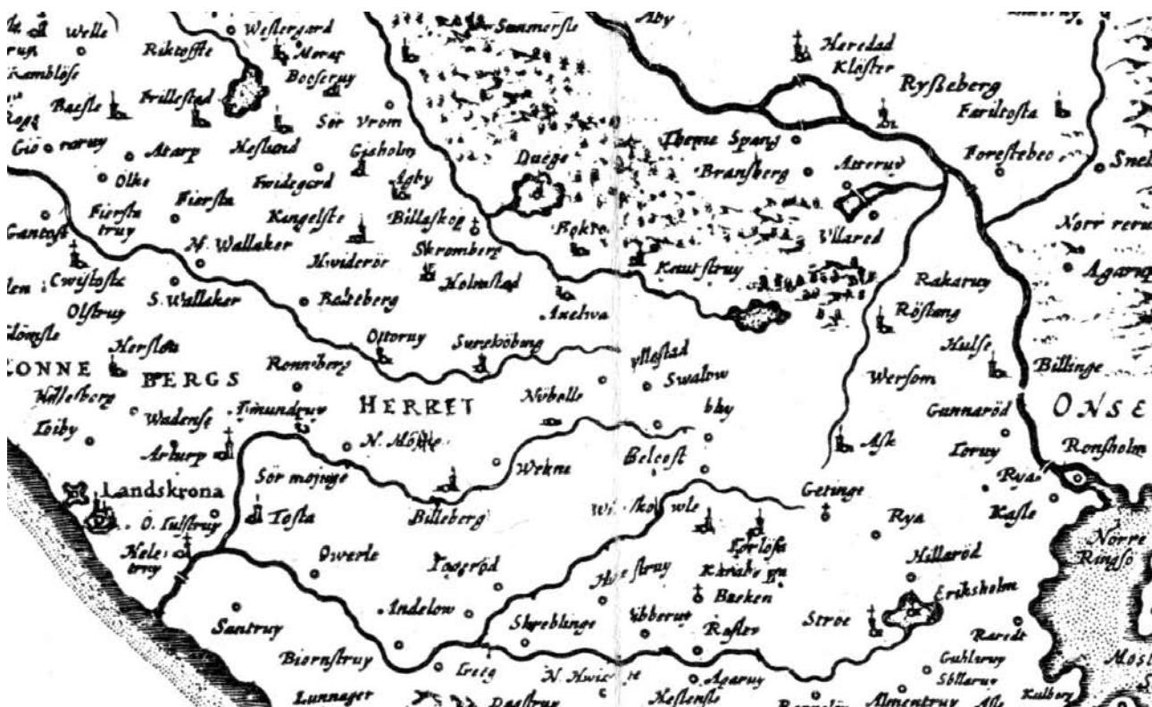
Skånekarta, tryckt i Amsterdam 1646 av Janssonius