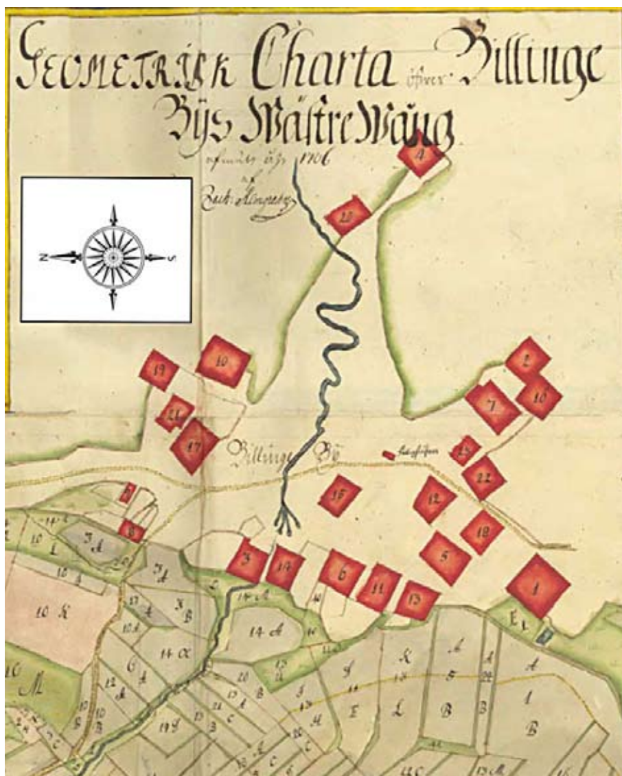
Billinge år 1706 (från Lantmäteriets "Historiska kartor"). Obs kartans orientering, (Norr åt vänster).