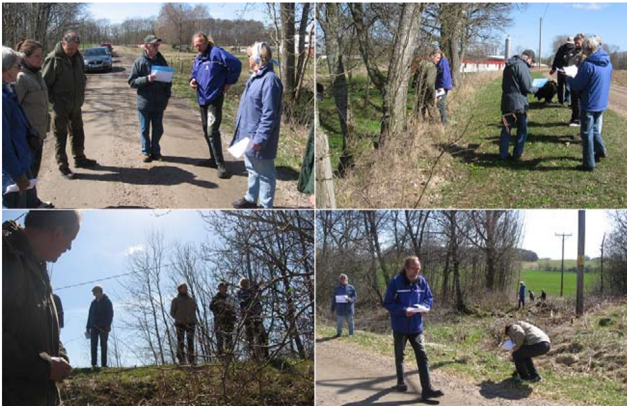
Kulturlandskapsgruppen i arbete med att kartlägga de spår som fortfarande finns att se från den en gång så använda möllan.